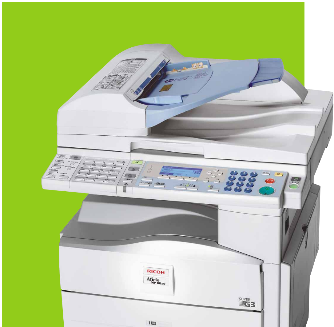
Aficio™ MP 161F/MP 161SPF